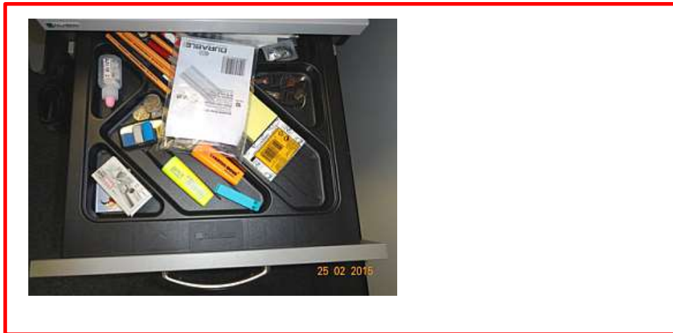
Situation Vorher (Bild)